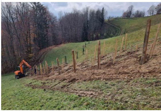
Slika 27: Mehansko izvajanje pripraviljalnih del