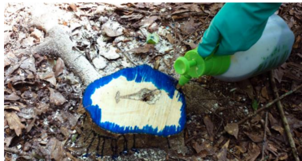
Slika 8: Uporaba FFS za zatiranje invazivnih vrst

Za uporabo herbicidov veljajo določena osnovna načela. Najprej je pomembno, da se herbicidi uporabljajo le takrat, ko je korist zatiranja invazivnih rastlin večja od morebitnih negativnih učinkov na druge organizme in celoten ekosistem. Pri uporabi je treba natančno upoštevati vsa navodila proizvajalca, kar vključuje pravilno doziranje, čas uporabe in način aplikacije. Ključno je tudi, da se pri uporabi herbicidov čim bolj zmanjšajo možnosti za negativne vplive na okolje, kot so kontaminacija vode, poškodbe neciljnih rastlin in škodljiv vpliv na živalstvo.