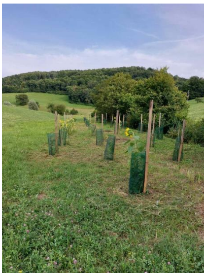
Slika 23: zaščitene sadike na KG Vertovšek

Spodbujamo naravno vrstno sestavo , za kar pa je pomembno tudi dobro prepoznavanje rastlinskih vrst.