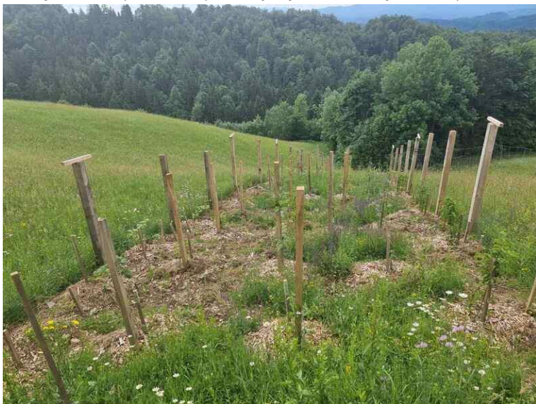
Slika 20: Mejice na KG Udovč takoj po zasaditvi in pred postavitvijo zaščitne ograje.

s tem izboljšali pogoje za različne divje živali, predvsem ptice, kmetiji bomo zagotovili plodove, ki so užitni in uporabni, vrste pa so hkrati tudi večinoma medonosne in zato zanimive za čebelarjenje. Na območje smo vnašali tudi mikorizirane sadike s poletno gomoljik, ki sicer v bližnji okolici po naših preverjanjih do sedaj ni bila prisotna.