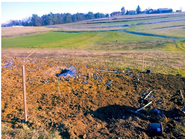
Slika 22: KG Makrobios