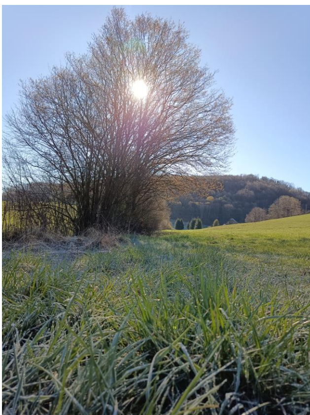
Slika 62: Del mejice na KG Vertovšek

V prvi polovici leta 2024 je potekalo 6. in hkrati zadnje šestmesečje triletnega Evropsko inovacijskega projekta (EIP) z naslovom »Mejice kot podpora biotski raznolikosti, ohranjanju tradicionalnega in izginjajočega kulturnega vzorca slovenskega podeželja ter zagotavljanju ekosistemskih storitev«. Osnovni namen projekta je ozavestiti in usposobiti deležnike, predvsem kmetijska gospodarstva ter strokovno in laično javnost o znanjih in veščinah vzpostavljanja in ohranjanja mejic, ki predstavljajo enega izmed najvrednejših elementov kulturne krajine in stalnico kmetijskega prostora. V skladu z namenom je bilo definiranih več ciljev, med njimi tudi razvoj novih in sodobnih rešitev na področju vzpostavljanja in vzdrževanja mejic, ki bodo bistveno prispevale k večanju vrstne pestrosti na kmetijskih gospodarstvih ter zmanjšanju in blaženju vpliva podnebnih sprememb na širše okolje.