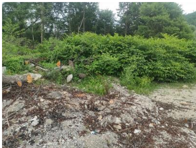
Slika 5: Neurejena območja nasipanj so pogosta lokacija pojavov tujerodnih invazivnih vrst.

Poleg morfoloških značilnosti in rastišča je pomembno tudi opazovanje sezonskih vzorcev rasti in širjenja teh rastlin. Invazivne vrste pogosto cvetijo in tvorijo semena prej kot lokalne vrste, kar jim omogoča prednost v tekmi za prostor in vire. Pravočasno prepoznavanje in ukrepanje proti tem rastlinam je bistveno za ohranjanje biotske raznovrstnosti in zdravja naših ekosistemov.