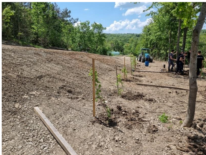
Slika 2: Delo na mejici, na kmetijskem gospodarstvu Andrejevi.

Krajinske vloge mejic pogosto ostajajo manj izpostavljene, med njimi pa zagotovo lahko prepoznamo mejice kot tradicionalen element kulturne krajine za razmejevanje površin, imajo vlogo pri zagotavljanju mozaičnosti krajine in imajo nenazadnje estetski vpliv v krajini.