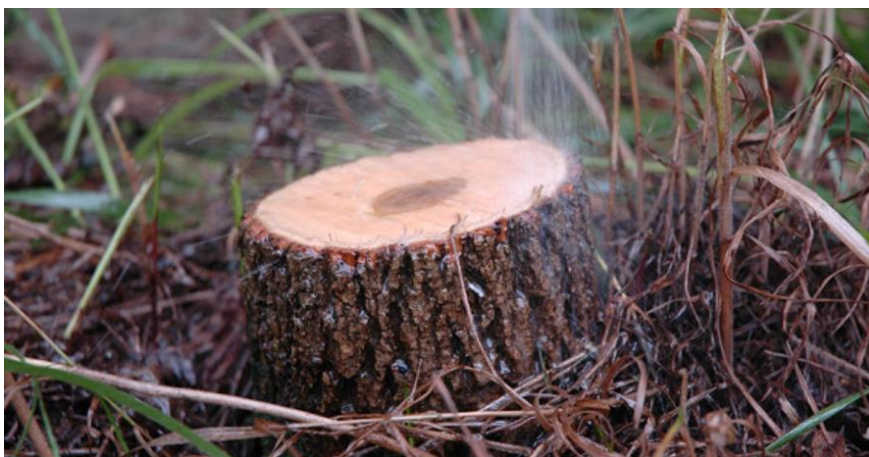
Slika 11: Po končanem mehničnem ukrepu sledi še kemični ukrep - tretiranje panjev s FFS