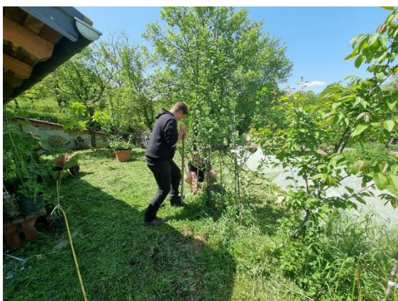
Slika 34: Količenje