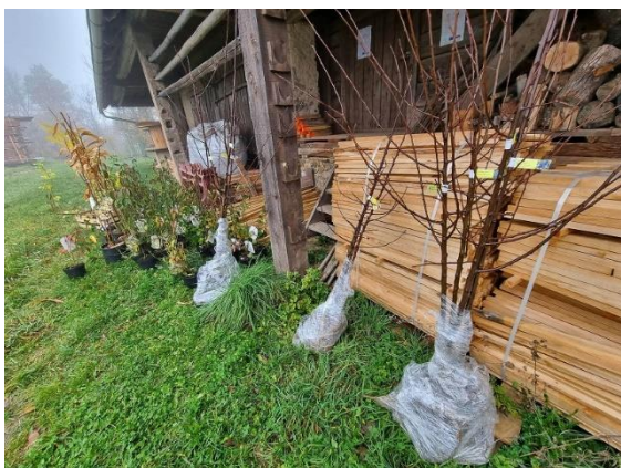
Slika 25: Prevzete sadike za KG Udovč