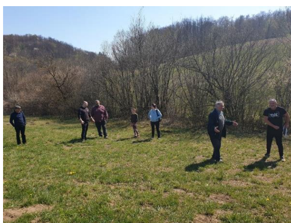
Slika 18: Začetno stanje zaraščenosti mejice na KG Verotvšek