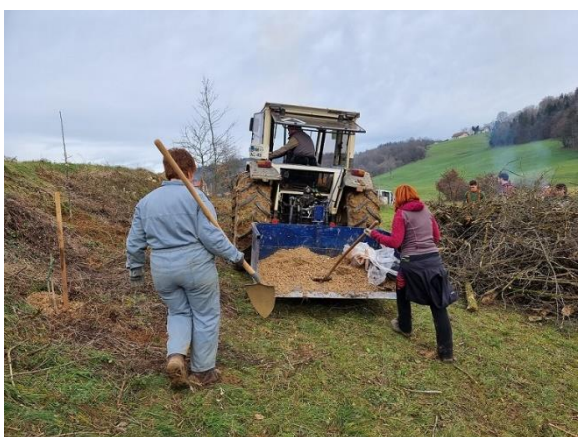
Slika 57: Delo na KG Grčman