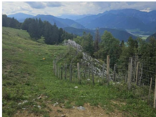
Slika 39: Lokacija mejice