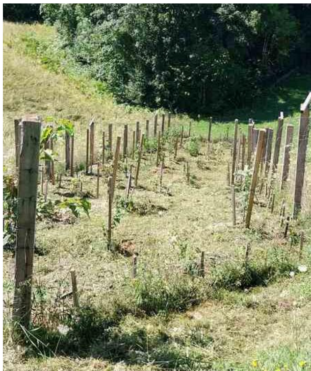
Slika 66: Zasajena in ograjena mejica na KG Udovč

Glavni namen mejice na kmetijskem gospodarstvu sodi med krajinske ekosistemske storitve in sicer smo pri zasaditvi predvsem želeli doseči estetski učinek in funkcijo razmejevanja parcel, v manjši meri pa tudi zaščita pred vetrom. Tudi ta mejica je vrstno bogata, izbor vrst je primarno namenjen medonosnosti (kar je tudi osnovna dejavnost kmetije), plodonosnosti in seveda vzgoji gomoljlik.