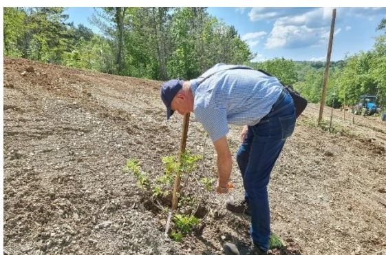
Slika 36: sadnja