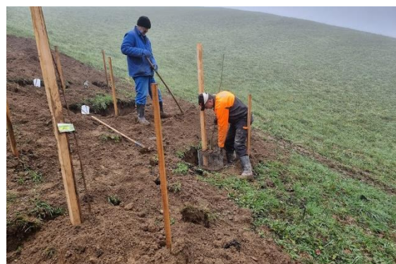
Slika 28: Priprava zaščite sadik