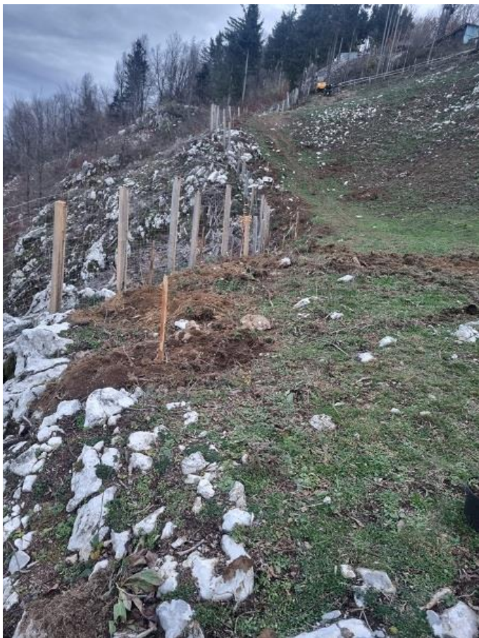
Slika 13: Območje mejice na KG Široko po izvedenem čiščenju, posegih v tla in sadnji načrtovanih drevesnih in grmovnih vrst