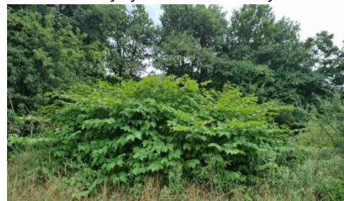
Slika 4: Poraščena površina z japonskim dresnikom

Transport blaga pogosto nenamerno širi dele rastlin, ki omogočajo njihovo razmnoževanje in širjenje. Zato je določeno obvezno preverjanje pošiljk na mejah, da bi preprečili nenamerni vnos invazivnih vrst. Ključna dejavnost v delovanju preventive je tudi ozaveščanje javnosti o škodljivih vplivih invazivnih rastlin. Kljub vsem sprejetim ukrepom ti za zdaj niso zadostni, saj se širjenje tujerodnih in invazivnih rastlin še vedno povečuje, kar posledično povzroča naraščanje ekološke in gospodarske škode. Invazivne rastline pogosto zelo negativno vplivajo tudi na zdravje ljudi, saj so mnoge med njimi alergene, strupene in lahko povzročajo različne zdravstvene težave.