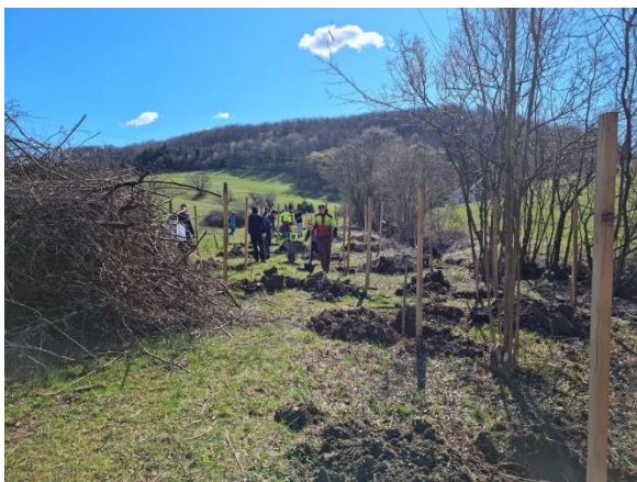
Slika 49: Očiščena mejica, pripravljena na sadnjo