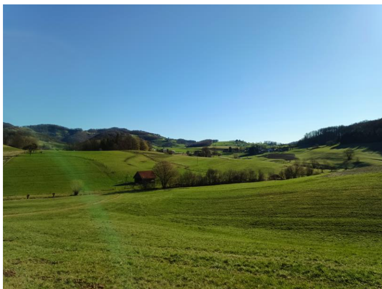
Slika 1: Mejica na kmetijskem gospodarstvu Vertovšek.

V letošnjem letu, maja 2024, se zaključuje triletni projekt Mejice kot podpora biotski raznolikosti, ohranjanju tradicionalnega in izginjajočega kulturnega vzorca slovenskega podeželja ter zagotavljanju ekosistemskih storitev - EIP 16.5 Mejice. Projekt izvajamo v okviru ukrepa M16 Sodelovanje Programa razvoja podeželja Republike Slovenije 2014-2020, v sklopu 3. javnega razpisa za podukrep 16.5 Podpora biotski raznolikosti, ohranjanju tradicionalnega in izginjajočega kulturnega vzorca slovenskega podeželja ter zagotavljanju ekosistemskih storitev . Projekt EIP 16.5 Mejice je tipa EIP - Evropsko partnerstvo za inovacije in se izvaja v sodelovanju strokovnih oz. svetovalnih, raziskovalnih ter izobraževalnih institucij na šestih kmetijskih gospodarstvih iz različnih statističnih regij, z različnimi izhodiščnimi stanji in pričakovanji ter z individualno prilagojenimi ukrepi za vzpostavitev oz. ureditev biotsko bogatih mejic. Projekt je sofinanciran s strani Republike Slovenije in Evropske unije iz kmetijskega sklada za razvoj podeželja in se izvaja med majem 2021 in majem 2024.