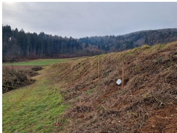
Slika 54: Očiščena mejica na KGGrčman