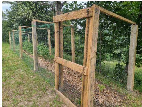
Slika 31: Zaščitena mejica