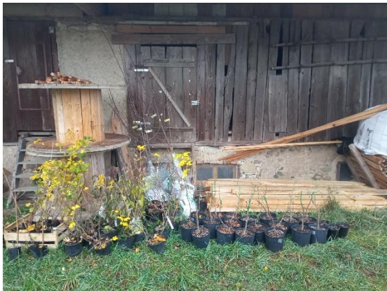
Slika 32: Prevezete sadike za KG Andrejevi