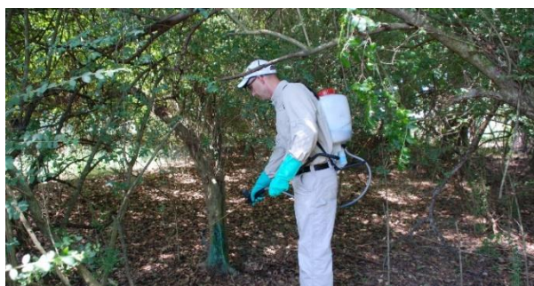
Slika 7: Kemično tretiranje panja invazivke

Kemično zatiranje invazivnih in tujerodnih rastlin vključuje uporabo herbicidov za obvladovanje in odstranjevanje teh vrst. Pred začetkom uporabe herbicidov je nujno preveriti veljavno zakonodajo in upoštevati navodila za ravnanje s fitofarmaceutskimi sredstvi (FFS). Uporaba herbicidov je regulirana in zahteva dosledno upoštevanje predpisov, da se zagotovi varno in učinkovito ravnanje ter minimalizirajo negativni vplivi na okolje.