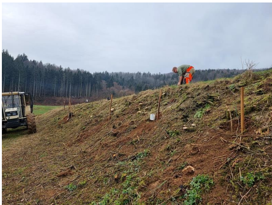
Slika 67: Mejica na kmetijskem gospodarstvu Grčman po zasaditvi nosilnih (drevesnih) vrst.

Delno obnovljeno in delno na novo posajeno mejica je na kmetijskem gospodarstvu Grčman smo zasajevalji predvsem z medonosnimi in aromatičnimi vrstami (divji hmelj). Nekatere med njimi so zabeležili v mejici že pred obnovo. Medonosne in aromatične vrstami smo sadili v dele mejice, kjer so prevladovala ilovnata tal, na delih (mikrolokacijah) kjer pa smo na terenskem ogledu in ob sami pripravi tal za mejico ugotovili večjo skeletnost tal pa smo v večji gostoti sadili tudi z gomoljikami okužene sadike. Kmetija Grčman bi lahko s svojim primerom ohranjanja in revitalizacije mejic pokazala, kako lahko strukturo starih mej ohranjamo na območjih, sicer manj ugodnih za proizvodnjo in kmetovanje in izkoristimo njihov prvotni namen danes in v prihodnosti.