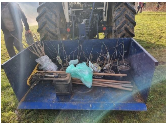
Slika 51: Sadike na KG Grčman