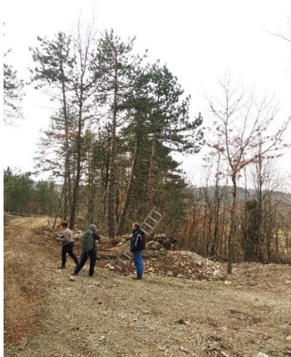
Slika 14: Območje načrtovane mejice na KG Andrejevih: višji del območja mejice na kamniti/peščeni podlagi pred pripravo področja za vzpostavitev mejice s prevladujočim črnim borom in puhastim hrastom

Območje načrtovanih mejic je bilo v času prvih popisov še delno poraščeno z naravno vegetacijo, ki jo je do sadnje lastnik odstranil. Na območju prevladujejo različno stara drevesa črnega bora ( Pinus nigra ) in jesena ( Fraxinus ornus ) oziroma v delu z večjim deležem terciarnih apnencev tudi hrasta puhavca ( Quercus pubescens ) in češnje ( Prunus avium ), z bolj ali manj gosto podrastjo kaline ( Ligustrum vulgare ), šipka ( Rosa spp.), posameznimi grmi divjega šparglja ( Asparagus spp.) in brinja ( Juniperus communis ). Mestoma se pojavlja tudi invazivna vrsta robinije ( Robinia pseudoaccacia ). Del načrtovane mejice se spušča v dolino, ob kateri rastejo posamezna drevesa lipovca ( Tilia cordata ) ter bližje ob vodi tudi vrbe ( Salix sp.) in črne jelše ( Alnus glutinosa ). Celotno traso mejice je v poletju 2022 lastnik očistil in delno reguliral pot manjšega hudourniškega potoka, pri čemer je na lokaciji načrtovane mejice puščal posamezna stebela lipe in hrasta, ostalo vegetacijo pa je načrtno odstranil.