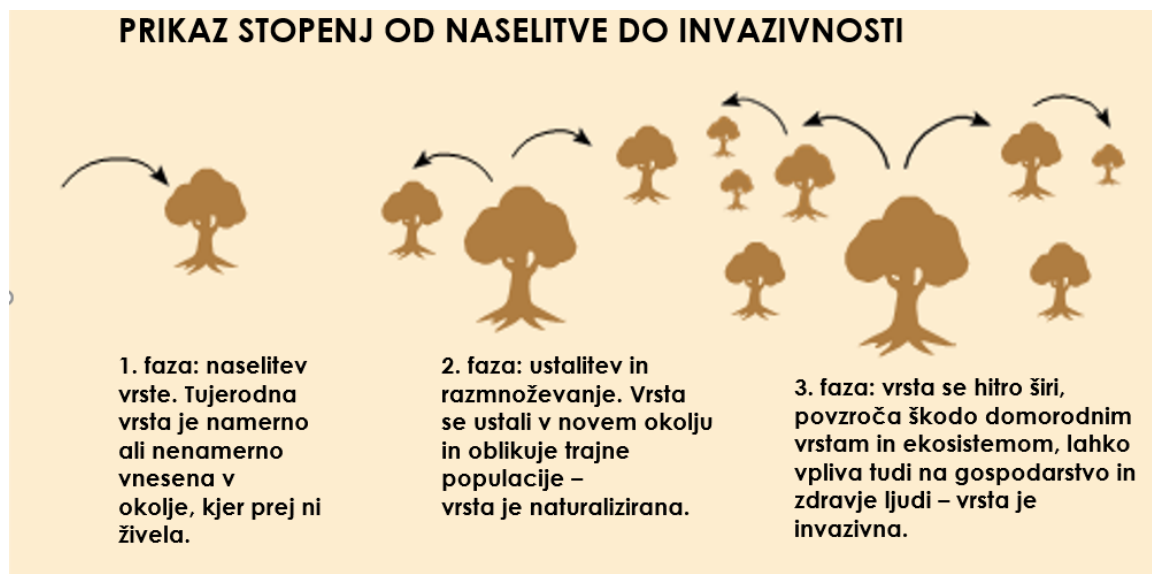
Slika 3: Stopnje razvoja od naselitve do invazivnosti rastline

vrste ter ekosisteme. V tej fazi invazivne rastline izpodrivajo domorodne vrste, spreminjajo habitatne razmere in pogosto povzročijo velike ekološke in ekonomske škode.