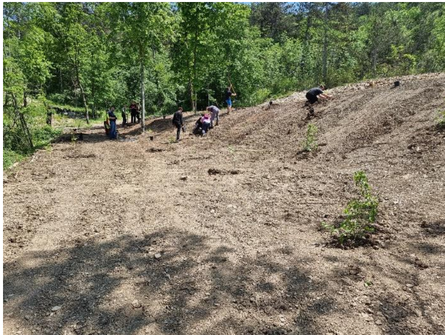
Slika 16: Pogled na severni del mejice KG Andrejevi po pripravi področja za sadnji in pred začetkom sadnje celotne mejice. V oddaljenem delu nastajajoče mejice vidimo ohranjena posamezna debela lipe.

poletne gomoljike daleč najboljši. Poleg neodstranjenih posameznih lip smo na območju mejice ohranili tudi nekaj dreves črnega bora, predvsem za namen utrjevanje sicer relativno strmega pobočja neposredno pod gozdno potjo.