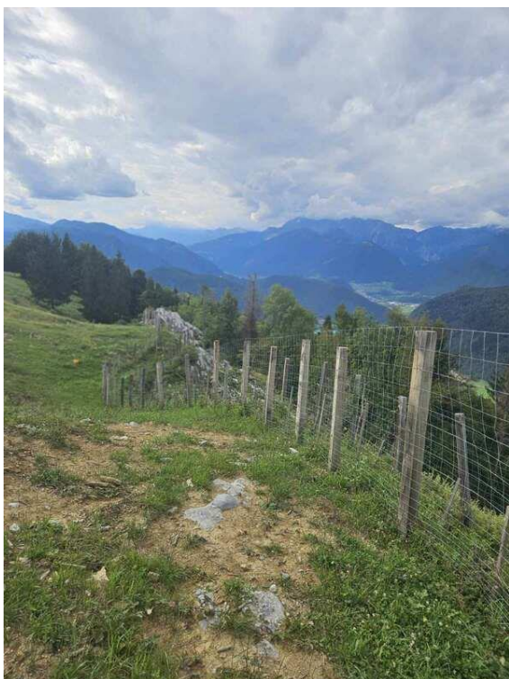
Slika 65: Lokacija mejice na KG Široko

V celoti na novo posajena mejica je na kmetijskem gospodarstvu Široko najpestrejša med vsemi, tako ko geološki podlagi, ki je bilo poglavitno vodilo za tako pestro mejico, kot tudi zaradi širokega interes lastnika in seveda možnosti, ki jih naravne danosti nudijo. Poglavitna ekosistemska storitev mejice na kmetijskem gospodarstvu Široko je protivetrna zaščita s severne strani (na fotografiji dolina na desni strani) ter levo kot zaščita pred izpiranjem hranil s kmetijske površine. Glede želje po proizvodnji smo lastnika upoštevali v vseh željah, tako da smo v mejico sadili tako plodonosne vrste (leska, kostanj, jerebika, glog, bezeg in dren) kot medonosne (dren, glog), leska za pelod, breze za pridobivanje brezove vode ter leska in breza kot nosilki gomoljik.