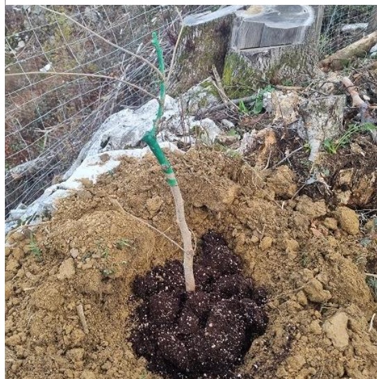
Slika 41: Posajena sadika