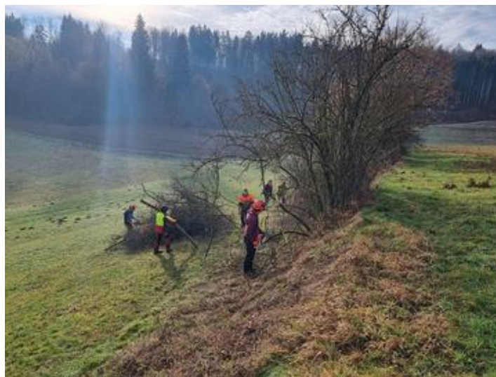
Slika 24: Čiščenje mejice na KG Grčman

Prostor je z ukrepi, izvedenimi v sklopu praktičnega preizkusa projekta, začel dobivati značilno krajinsko podobo . Z vnašanjem domačih (avtohtonih) plodonosnih in medovitih vrst smo povečali biotsko pestrost mejic . v naslednjih razvojnih fazah pa pričakujemo tudi povečanje ponudbe hrane na mejicah ter izboljšano estetsko funkcijo mejic . Površine izvedenih del na mejicah nam služijo tudi kot poskusna območja, kjer pridobivamo pomembna znanja o ukrepih na mejicah, vrstni pestrosti živalskega in rastlinskega sveta mejic, odnosu človeka do mejic in vzpostavitvi smernic za ravnanje z mejicami.