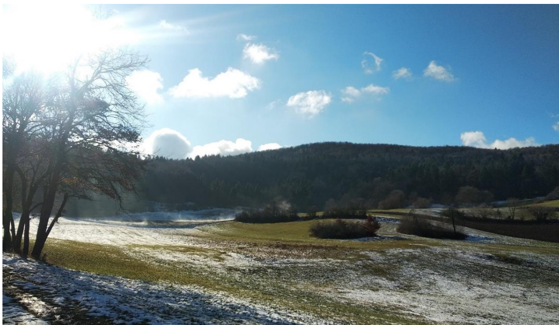
Slika 21: Širše območje načrtovane mejice na kmetiji Grčman. Mejica je načrtovana v desnem delu fotografije z že obstoječimi jedri drevesne in grmovne vegetacije.

Posamezne parcele kmetije so razdrobljene, po večini prevladujejo pašne površine in njive, kjer načrtujemo tudi umestitev mejice, in sicer na območje med terasami parcel. Klimatsko kmetija leži v kontinentalnem podnebnju osrednjega nizkega Krasa z izrazitimi klimatskimi (zima : poletje) in padavinskimi (jesenske poplave : polente suše) ekstremi. Tla so po večini rjava pokarbonatna, sprana in površinsko zakisana, razvita na sivih trših krednih apnencih. Globina tal izrazito variira, na več mestih, predvsem na območju med terasami matična kamenina pogosto pride do površine. pH tal v globljih plasteh in bliže skeletu/kameninski osnovi je zmerno nevtralen, sprani deli zemljine pa imajo pH v rangu med 5.0 in 6.5.