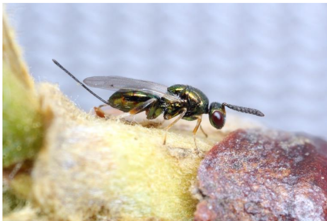
Slika 9: Parazitska osica za zatiranje kostanjeve šiškarice

Pri uporabi biotičnih ukrepov je ključno stalno spremljanje in ocenjevanje učinkovitosti ter možnih neželenih učinkov. Biotično varstvo pogosto zahteva sodelovanje z raziskovalnimi inštituti in strokovnjaki, ki lahko nudijo potrebno znanje in podporo. Naravni sovražniki se morajo redno spremljati, da se zagotovi njihova učinkovitost pri nadzoru invazivnih rastlin in da se pravočasno odkrijejo morebitne negativne posledice. Uspešno biotično varstvo lahko trajno zmanjša populacijo invazivnih rastlin, vendar je pomembno, da se ti ukrepi izvajajo v okviru celostnega pristopa k upravljanju invazivnih vrst, ki vključuje tudi mehanske, kemične in preventivne metode.