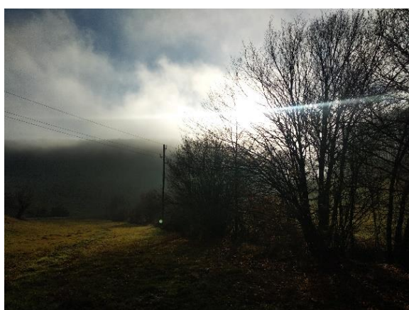
Slika 17: Začetno stanje zaraščenosti mejice na KG Vrtovšek

Ob prvem pregledu stanja smo ugotovili, da na lokaciji mejice že obstaja mejica, ki jo bomo očistili, pomladili in dosadili ciljne vrste. Lokacija se nahaja na dnu manjše doline, ob manjšem presihajočem potoku, orientirana v smeri Z-V. Dolina je poleti suha in presušena, medtem ko je v zimskem in pomladnem času ter v času obilnejših padavin delno zamočvirjena, kar se vzhodnem delu mejice kaže tudi s prisotnostjo šašov ( Carex spp.) tik ob meji z načrtovano mejico. Del območja mejice je bil nasut (pesek) z namenom dviga terena, kar se odraža tudi v vegetaciji, predvsem z večjim deležem detelje ( Trifolium spp.), po besedah lastnika naj bi šlo v tem delu za nedavno setev oziroma dosetev v obstoječo travno rušo. Na začetku mejice je nekaj starejših grmov bezga ( Sambucus nigra ), ki smo jih ohranili v obnovljeni mejici, dol-vodno ob potoku pa od drevesnih in grmovnih vrst prevladuje bela vrba ( Salix alba ), šipek ( Rosa sp.), navadna kalina ( Ligustrum vulgare ) in leska ( Corylus avellana ).