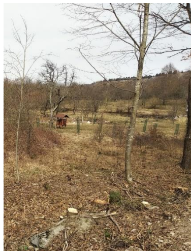
Slika 15: Območje načrtovane mejice na KG Andrejevi: področje mejice na flišni podlagi z že odstranjeno vegetacijo in dogovorjeno ohranjenimi posameznimi osebki lipovca.