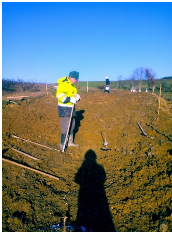
Slika 61: Urejanje terena za sadnjo