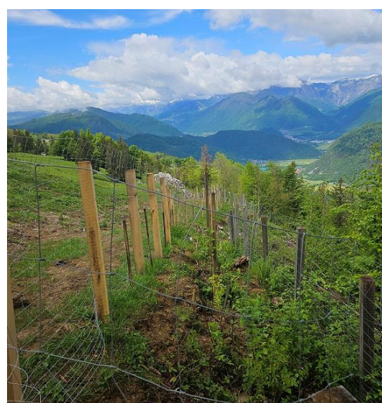
Slika 43: Mejica