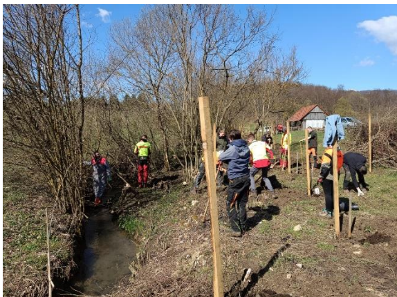
Slika 47: Delo na mejici ob potoku na KG Vertovšek