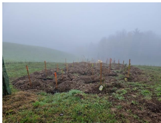
Slika 26: pripravljen teren za sadnjo