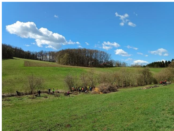
Slika 48: Delo na mejici na KG Vertovšek