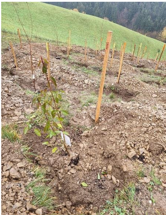
Slika 30: sajenje sadik