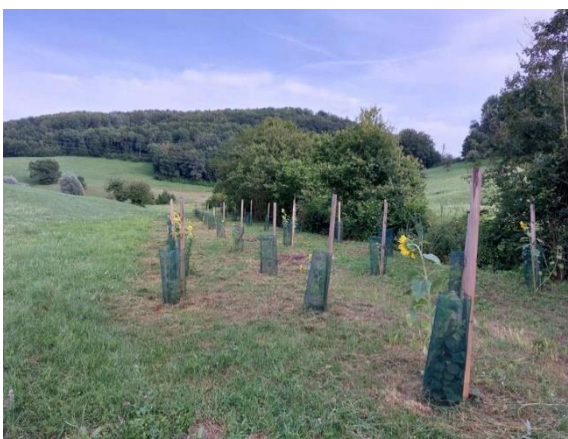
Slika 50: Zasajena in zaščitena mejica