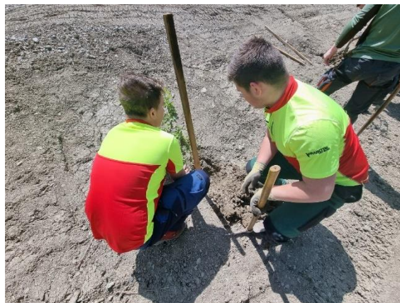
Slika 33: Sadnja