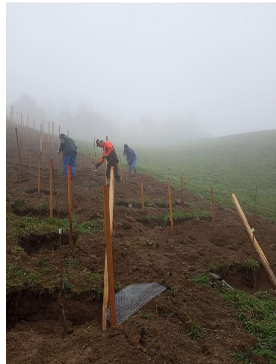
Slika 29: Priprava sadilnih lukenj