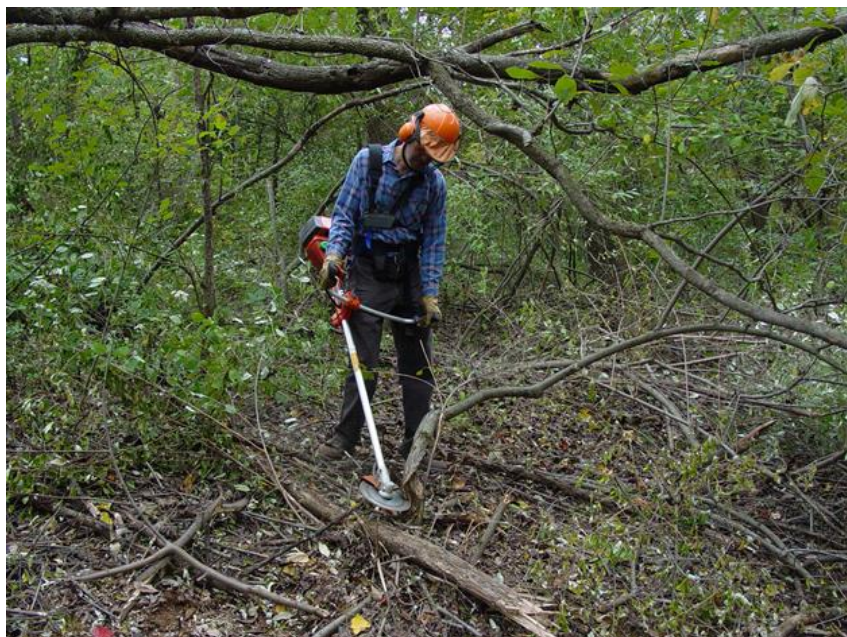
Slika 10: Strajno odstranjevanje invazivk z motorno koso