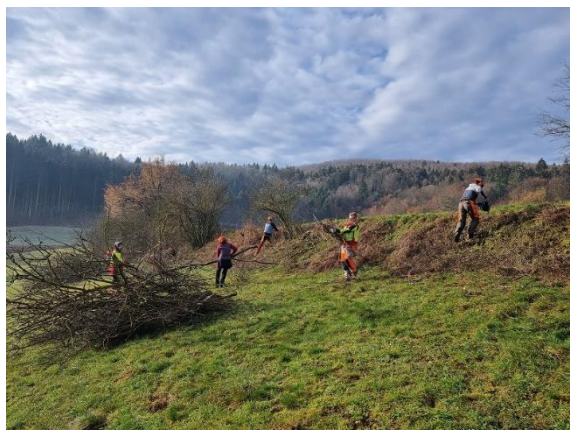
Slika 52: Čiščenje odvečnega materiala iz mejice