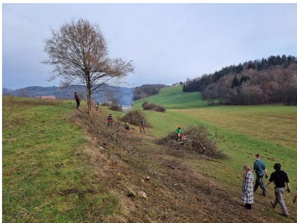
Slika 53: Delo v mejici