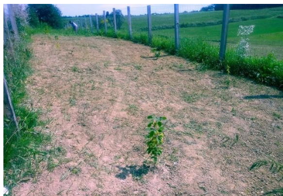
Slika 59: Delo na mejici