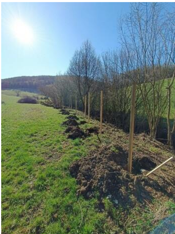
Slika 44: Sadilne jame na KG Vertovšek