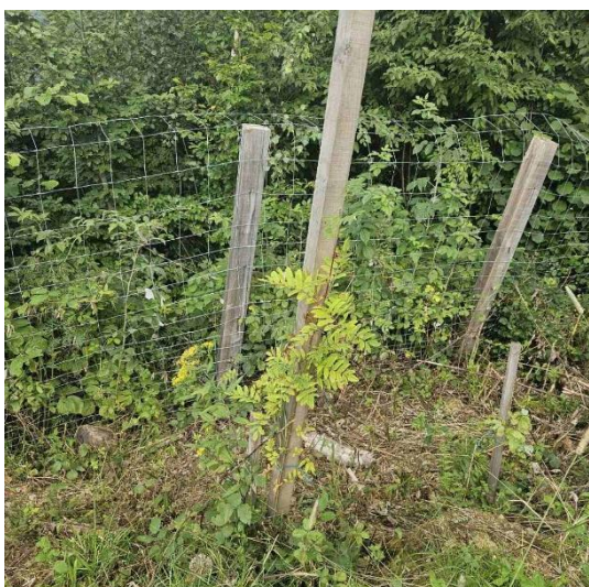
Slika 40: Posajena sadika