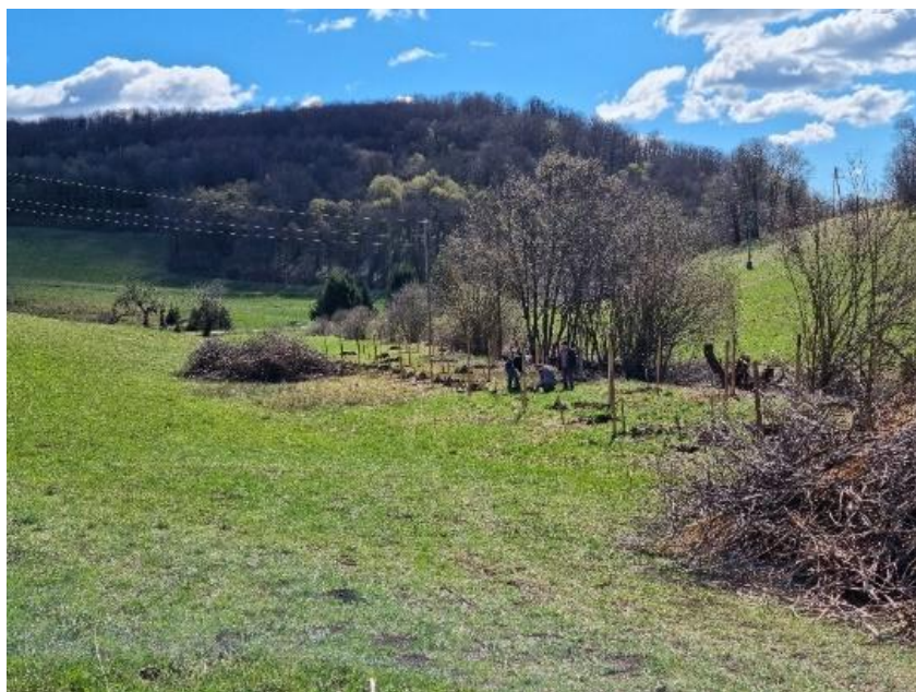
Slika 19: Delo na mejici na KG Vertovšek

Z vnosom izbranih rastlinskih vrst bomo še vnaprej zagotavljali sonaravno in pestro združbo mejice. Obnova smo usmerili predvsem v povečevanje plodonosnosti in medonosnosti mejice in povečanje tudi biotsko pestrost samega območja. Glede na to, da je večji del mejice na vsaj občasno poplavljenem območju oziroma na relativno mokrih in ilovnatih tleh, smo število z gomoljikami okuženih sadik omejili na minimum, saj tovrstne razmere praviloma ne ustrezajo gomoljikam. Kljub temu smo nekaj sadik posadili predvsem v del, na katerega je lastnik predhodno nasipal peščeni material. Glavni namen obnove te mejice pa je zagotavljanje zmanjšanja iztoka hranil in pesticidov z bližnjih kmetijskih površin v vodotok, ker seveda zagotavljanje tradicionalnega izgleda kmetijske krajine in meje s sosednjimi parcelami,