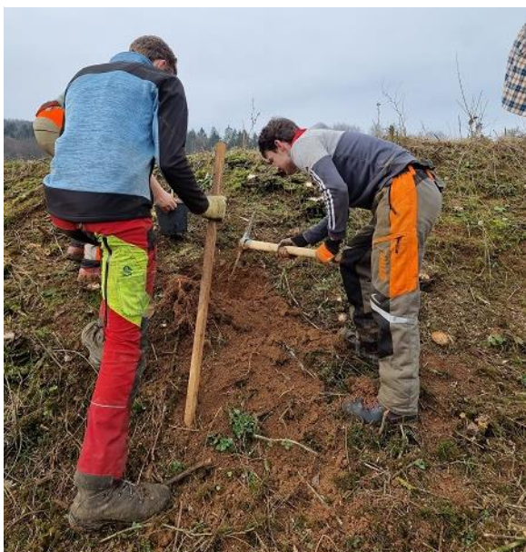
Slika 55: Sadnja sadik