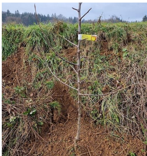
Slika 56: Posajena sadika