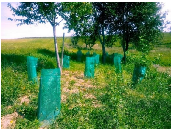
Slika 60: zasajena in zaščitenja mejica