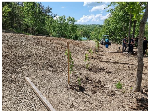
Slika 35: del nove mejice