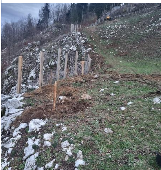
Slika 42: Lokacija in oblika mejice