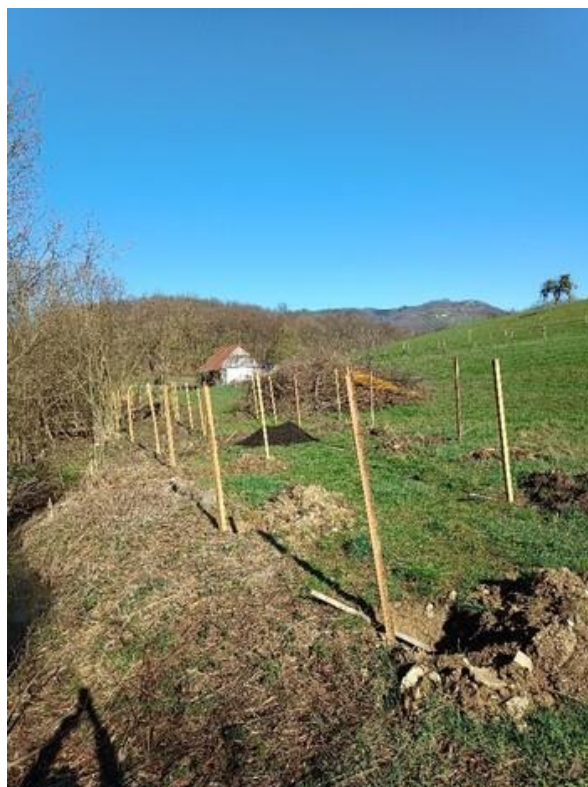
Slika 45: Sadilne jame in količenje na KG Vertovšek