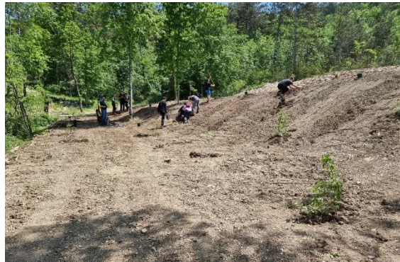
Slika 37: teren mejice