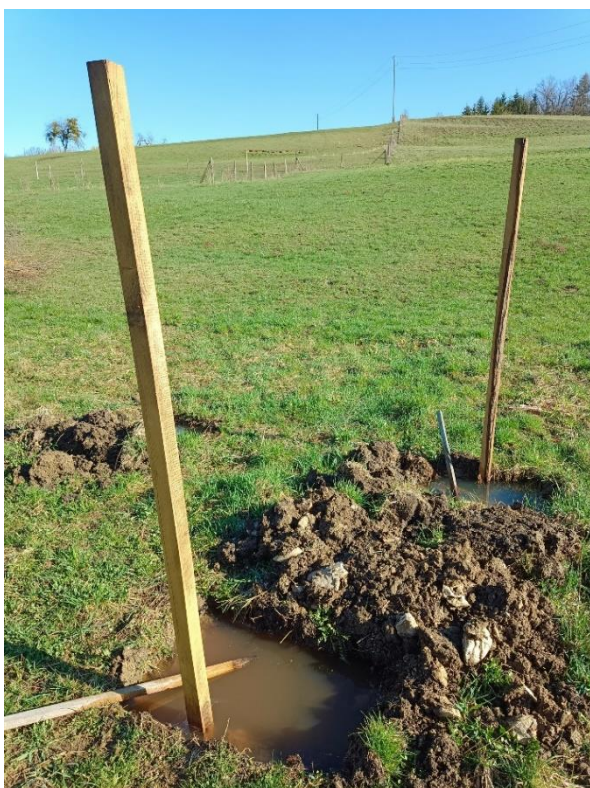
Slika 46: Poplavljene sadilne jame