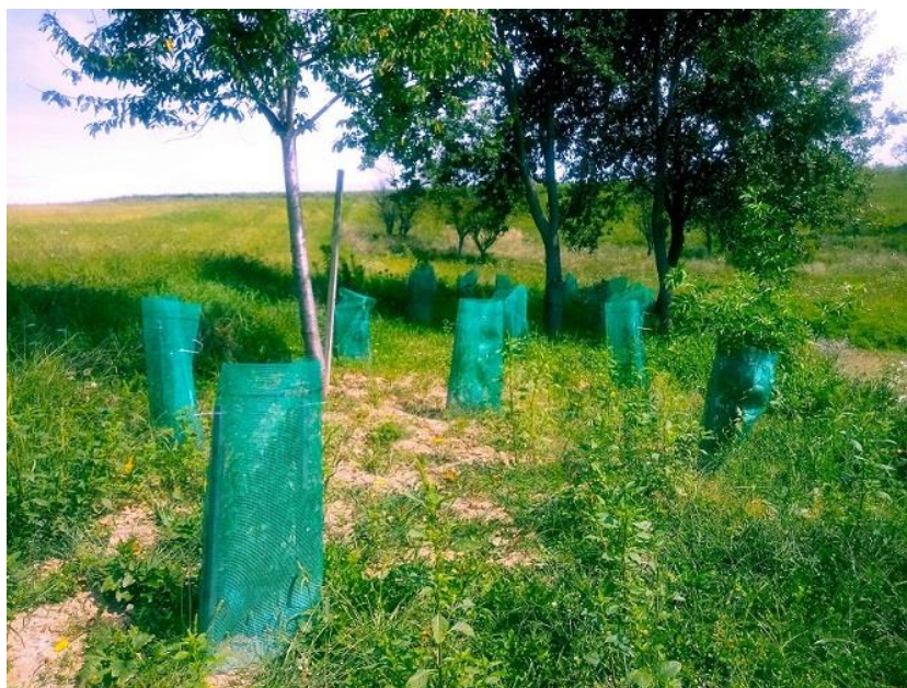
Slika 68: Na novo zasajena mejica

Mejico na kmetijskem gospodarstvu Makrobios smo v celoti zasadili na novo. Ekosistemske storitve mejice so tu manj izražene, predvidevamo pa da bo mejica imela predvsem vpliv na mikroklimo in na količino zadržanega ogljika v tleh. Na željo lastnice smo mejico zasnovali tako, da bo v prvi vrsti namenjena izobraževanju obiskovalcev kmetije ter plodonosnosti in gojenju gomoljik.