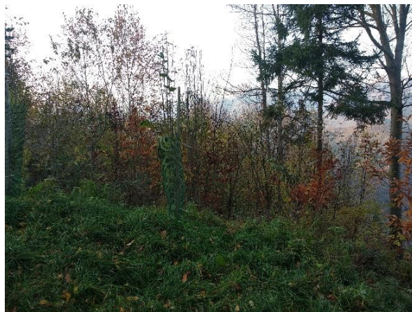
Slika 12: Začetno stanje na območju mejice na kmetijskem gospodarstvu Široko, levo pogled na zahodni, apnenčasti del ter desno pogled proti vzhodu na silikatni del območja.

Ob začetnem pregledu stanja smo ugotovili, da se lokacija bodoče mejice delno nahaja ob nastajajočem gozdnem robu, preostali del vegetacije pa bo odstranjen (glej spodaj). Med