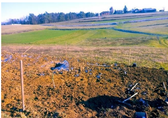
Slika 58: kopanje sadilnih jam in količenje