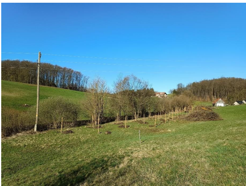
Slika 63: Zasajena mejica na KG Vertovšek

Kmetija Vertovšek se nahaja v krški občini, na obrobju Kozjanskega, na gričevnatem območju, na nadmorski višini okoli 316 metrov. Razpolagajo s približno sedmimi hektarji površine, od tega je pomembno zastopan tudi gozd. Umeščena je v tipično in dobro ohranjeno ekstenzivno kulturno krajino, kjer se prepletajo manjše vasi in domačije in se na majhnih površinah izmenjujejo travniki z visokodebelnimi sadovnjaki, posamezne njive, mejice in gozdni robovi. Obnovljena in dosajena mejica zasleduje bistveno ekosistemsko storitev – varovanje bližnjega vodnega telesa pred iztokom hranil in fitofarmaceutskih sredstev s kmetijskih površin, proizvodnja vloga pa je pretežno usmerjena v pridobivanje jagodičevja in sadja za prehrano divjadi in za uporabo v kulinariki.