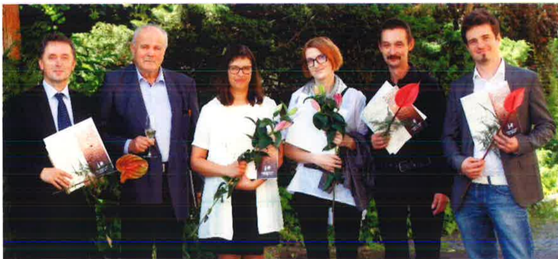
Nagrajeni sodelavci ob 70 letnici Gozdarskega Inštituta Slovenije