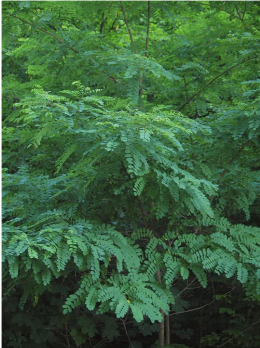
Robinija je hitro rastoča drevesna vrsta