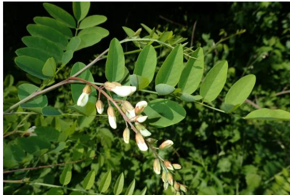
Za robinijo so značilni nežni lističi v obliki elips, dišeči cvetovi in razbrazdano lubje